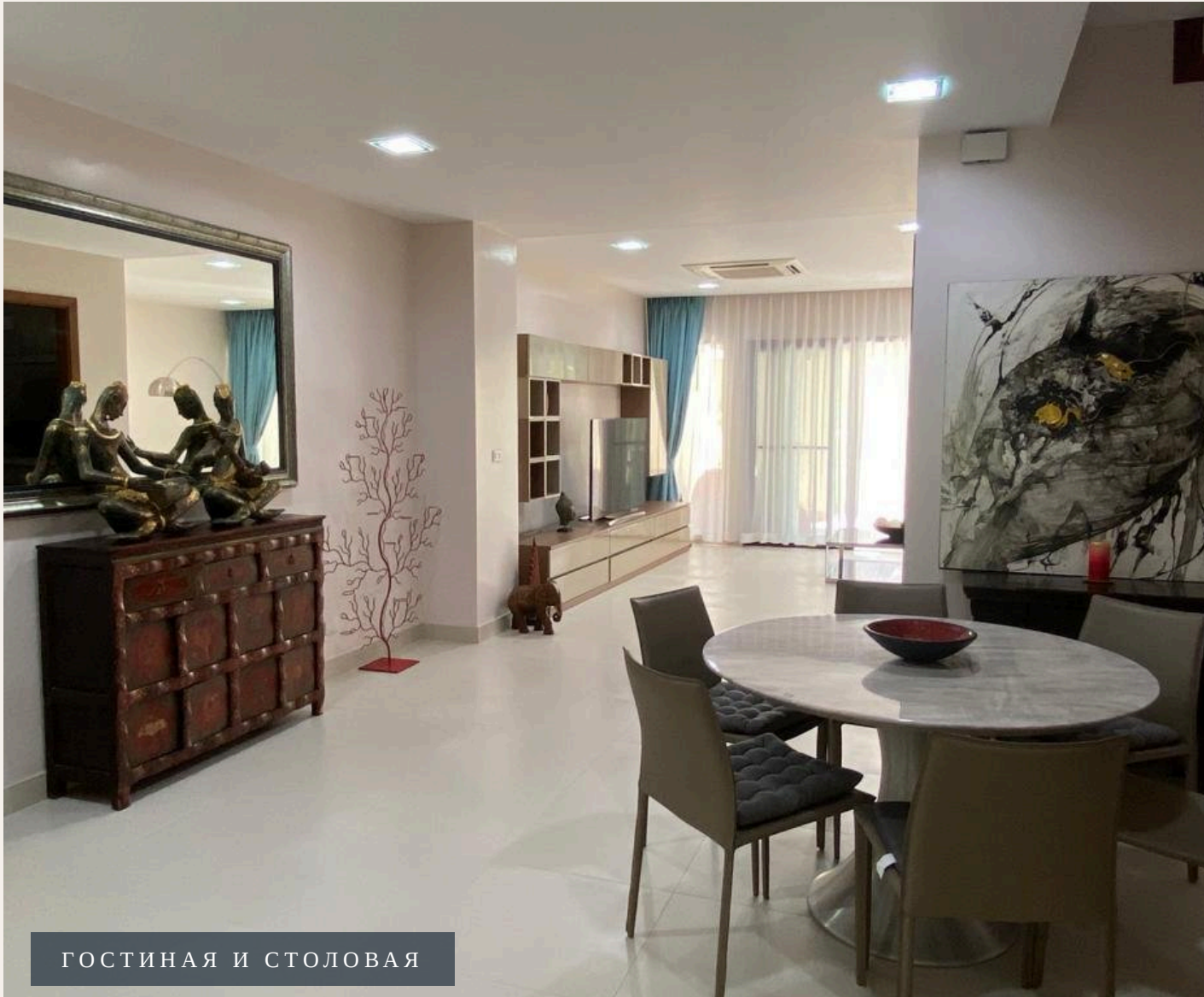
ГОСТИНАЯ И СТОЛОВАЯ