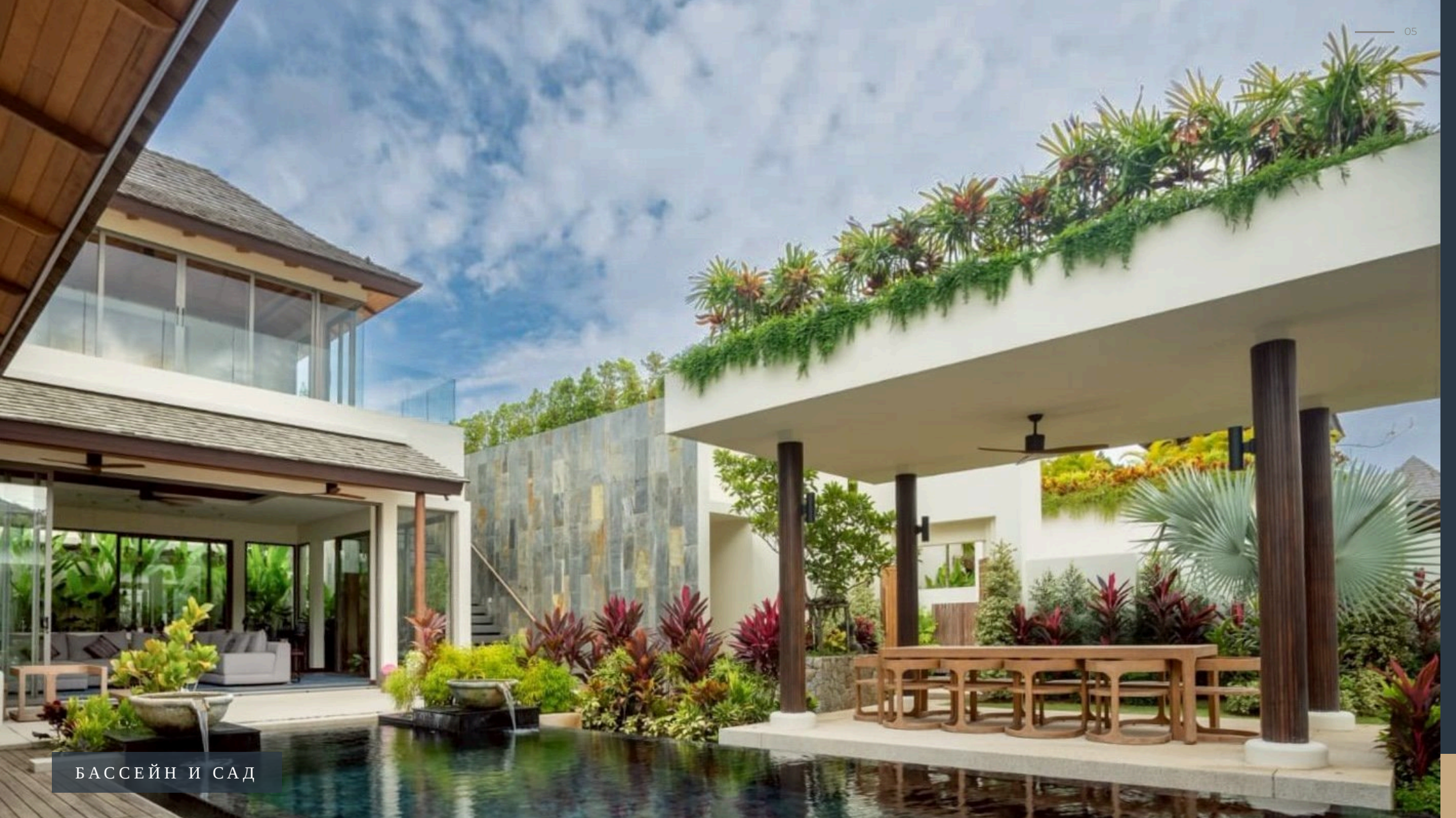
БАССЕЙН И САД