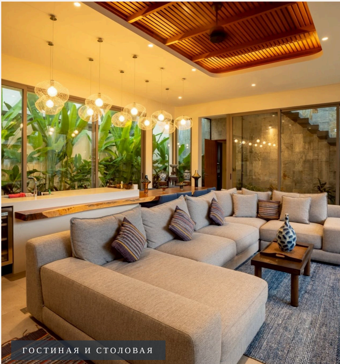
ГОСТИНАЯ И СТОЛОВАЯ