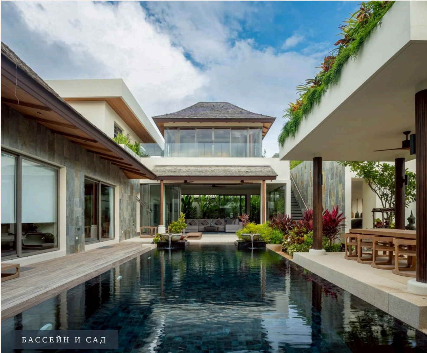
БАСЕЙН И САД