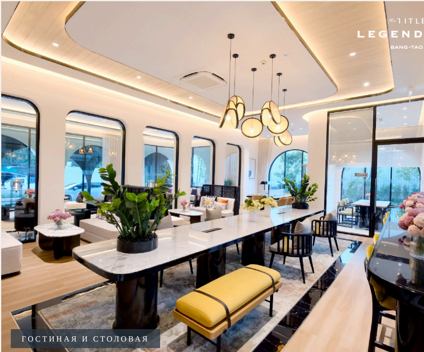
ГОСТИНАЯ И СТОЛОВАЯ