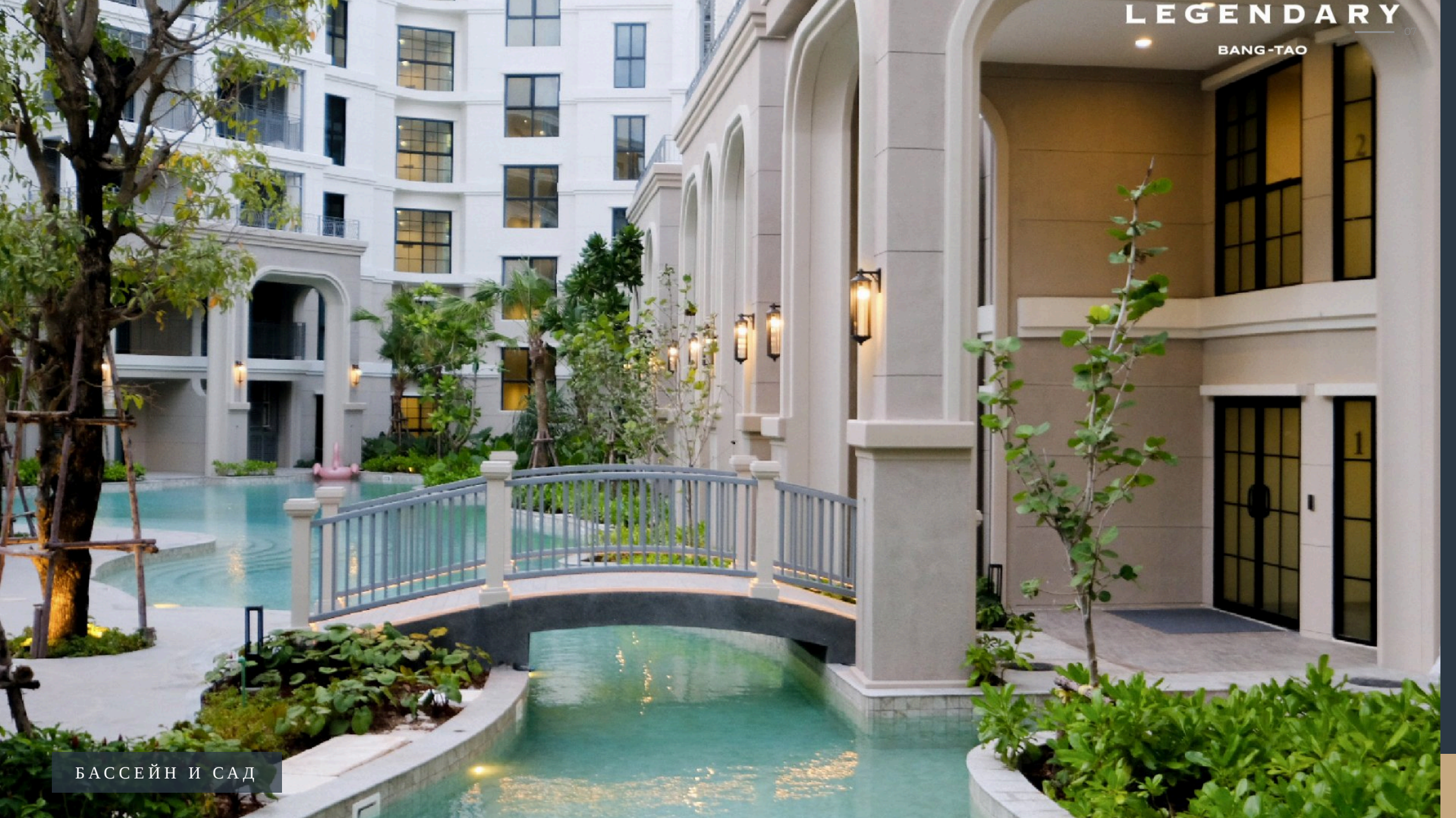
БАСЕЙН И САД