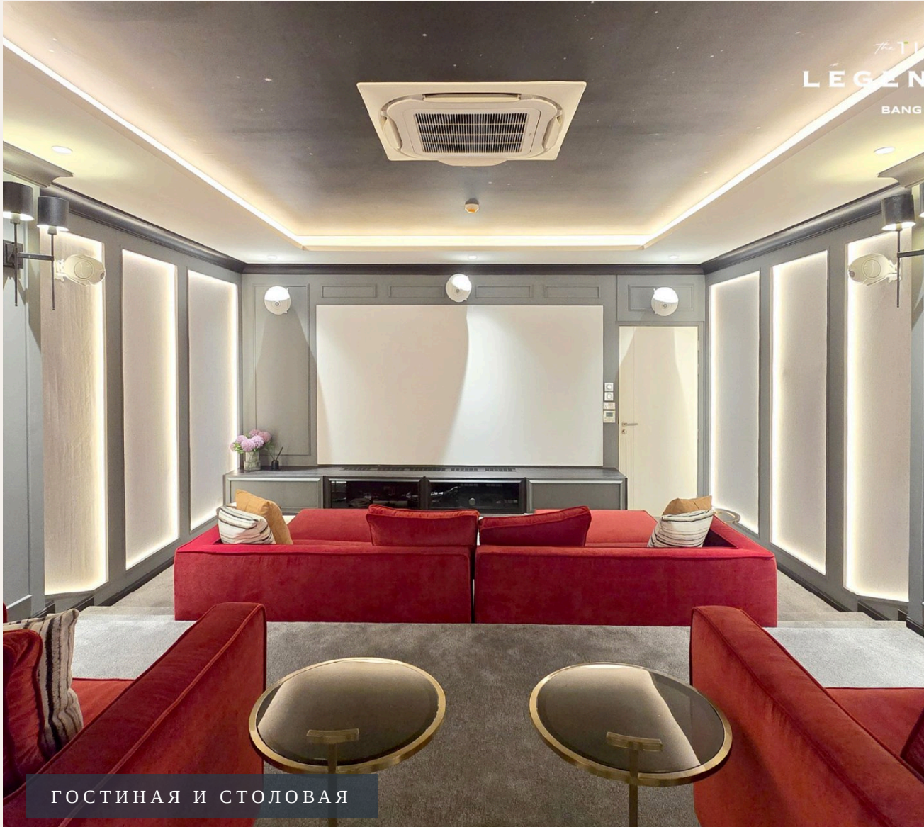
ГОСТИНАЯ И СТОЛОВАЯ