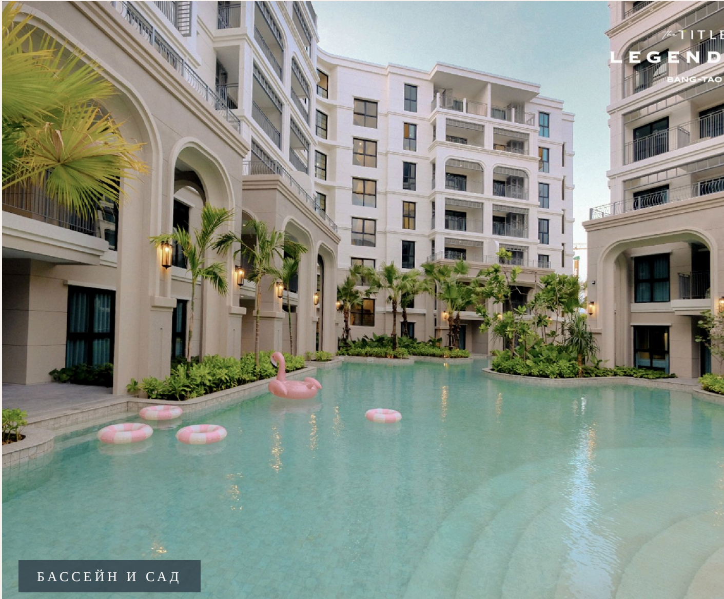
БАСЕЙН И САД