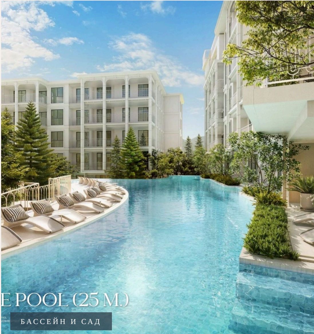
E POOL (25 M.)