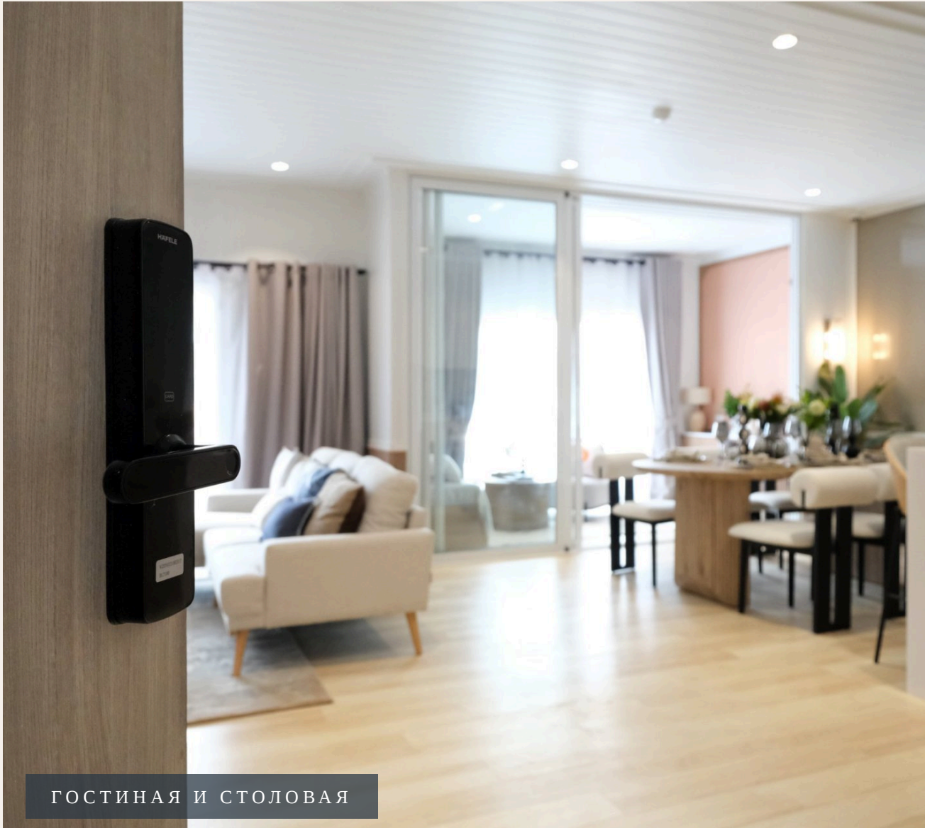
ГОСТИНАЯ И СТОЛОВАЯ