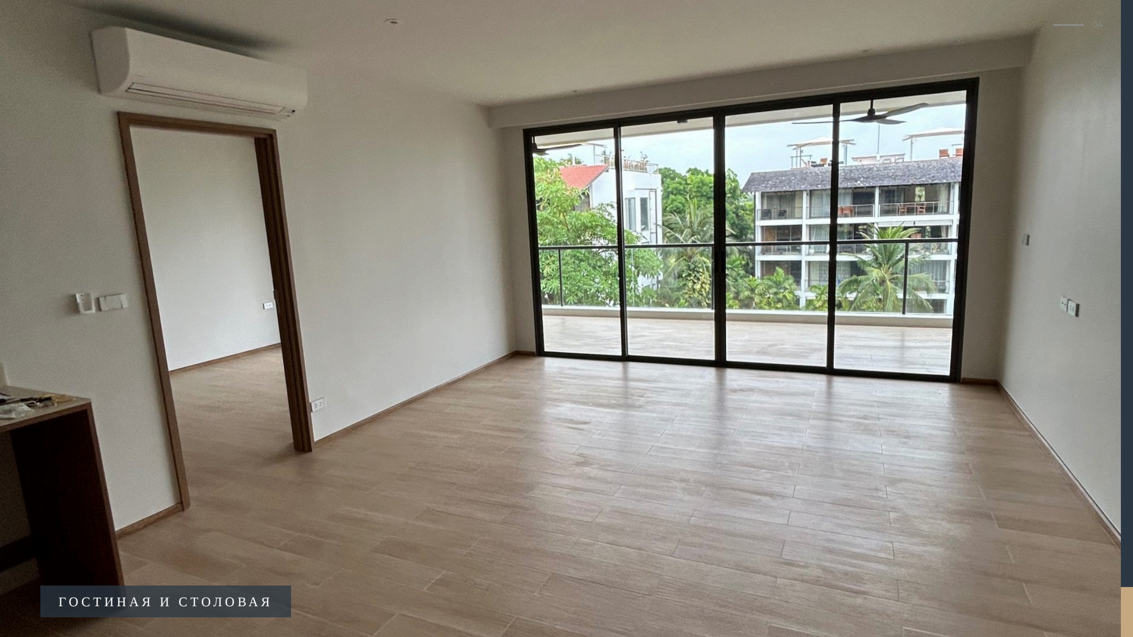
ГОСТИНАЯ И СТОЛОВАЯ