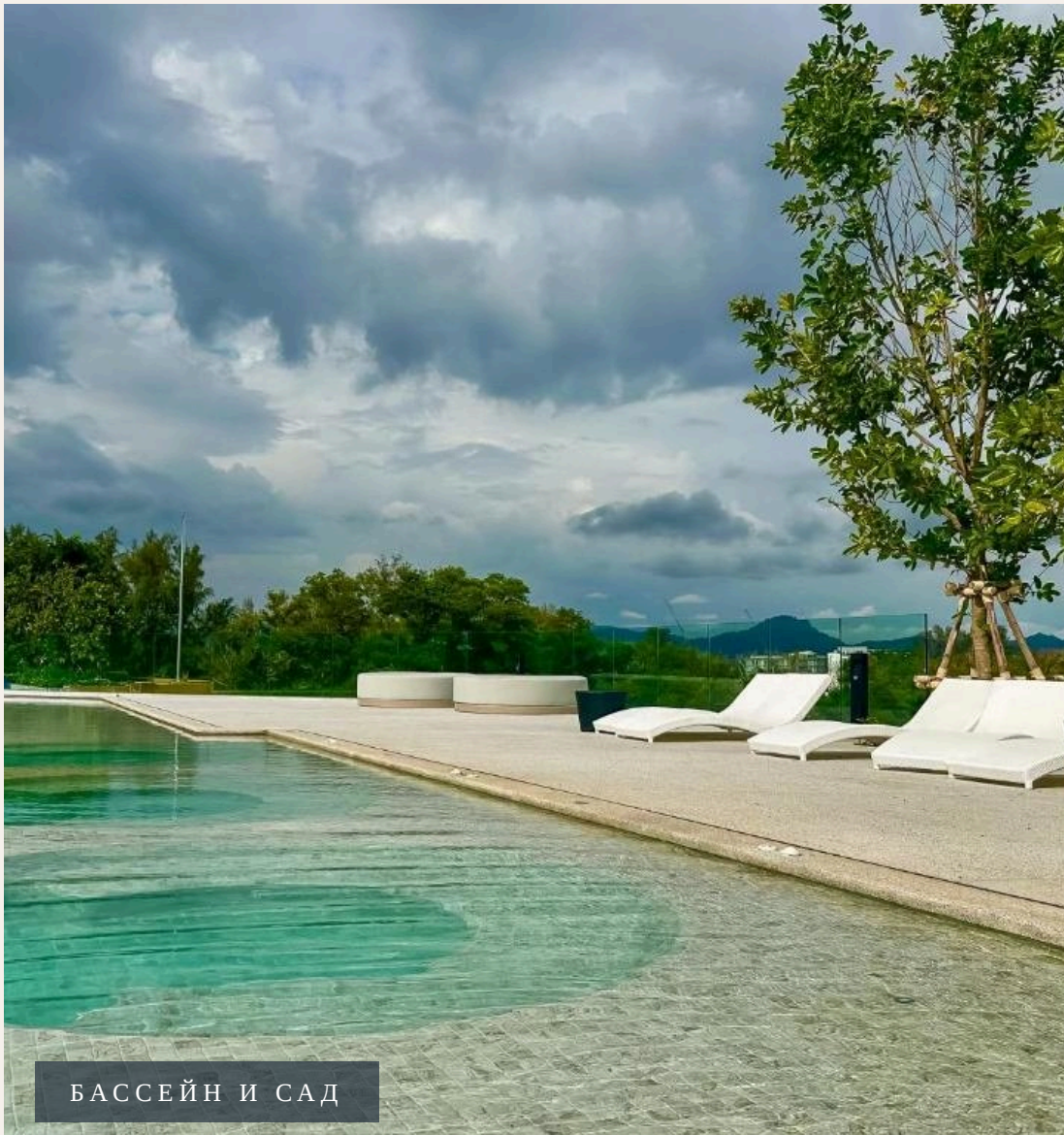
БАСЕЙН И САД