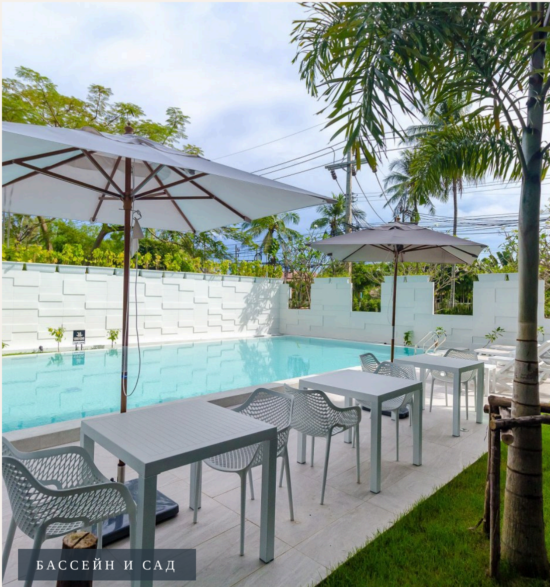
БАСЕЙН И САД