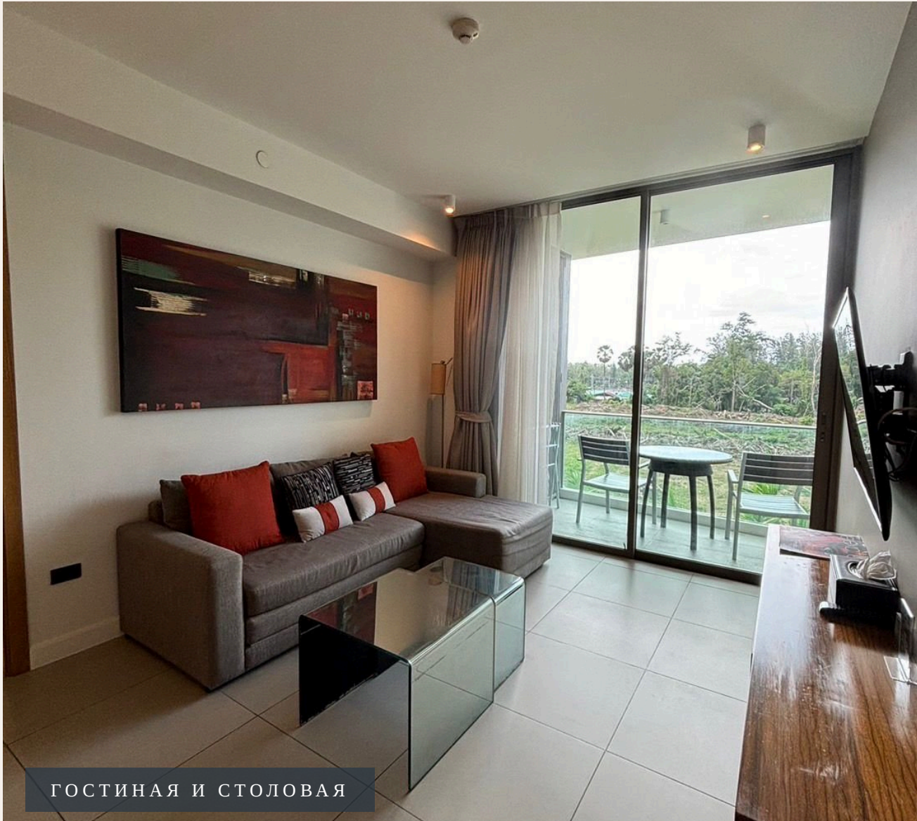
ГОСТИНАЯ И СТОЛОВАЯ