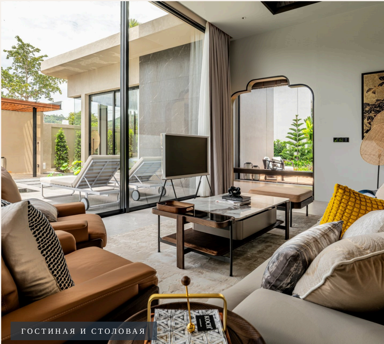
ГОСТИНАЯ И СТОЛОВАЯ