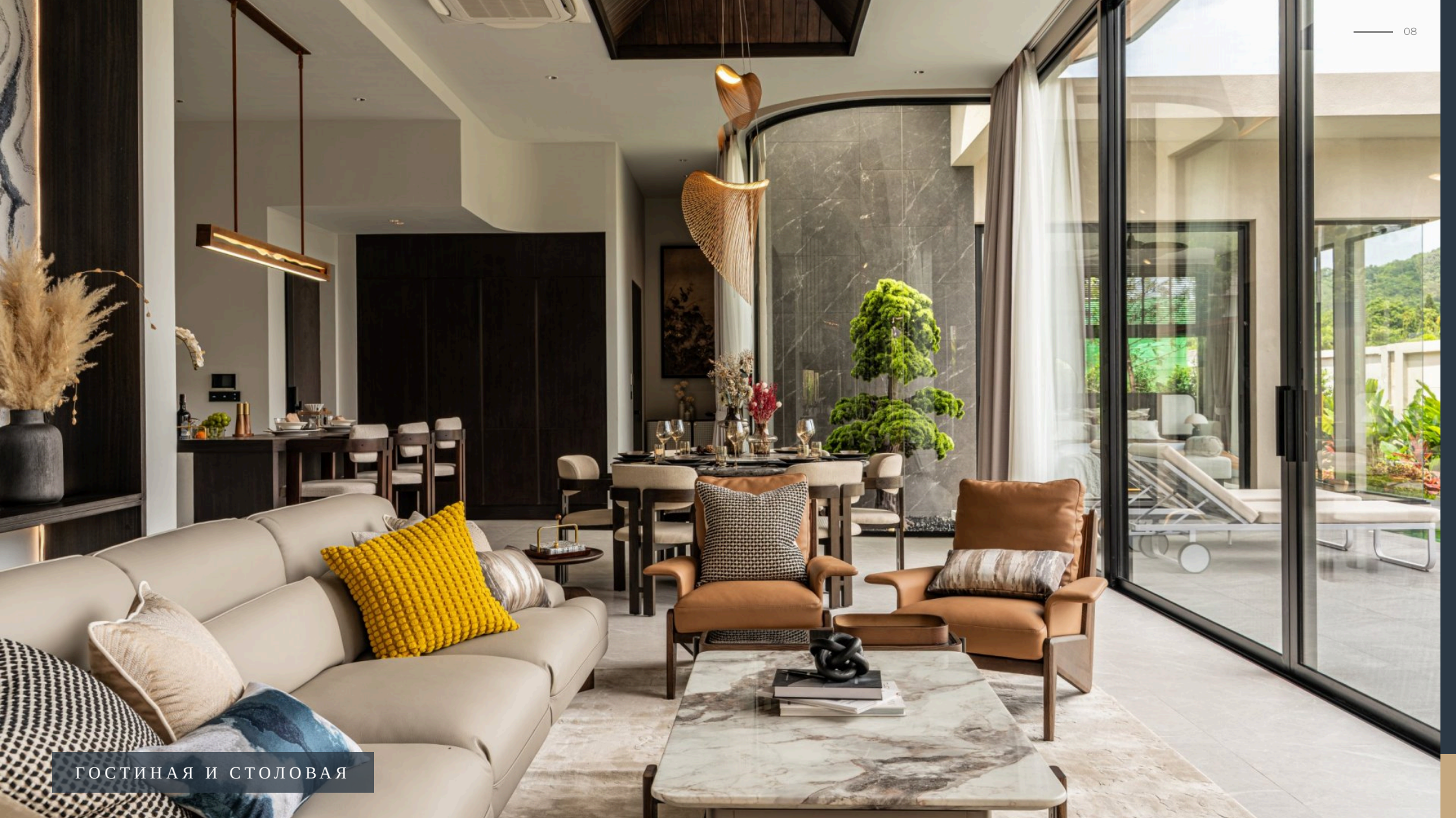
ГОСТИНАЯ И СТОЛОВАЯ