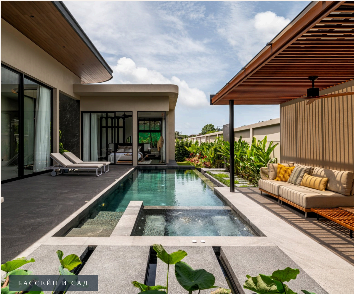
БАССЕЙН И САД