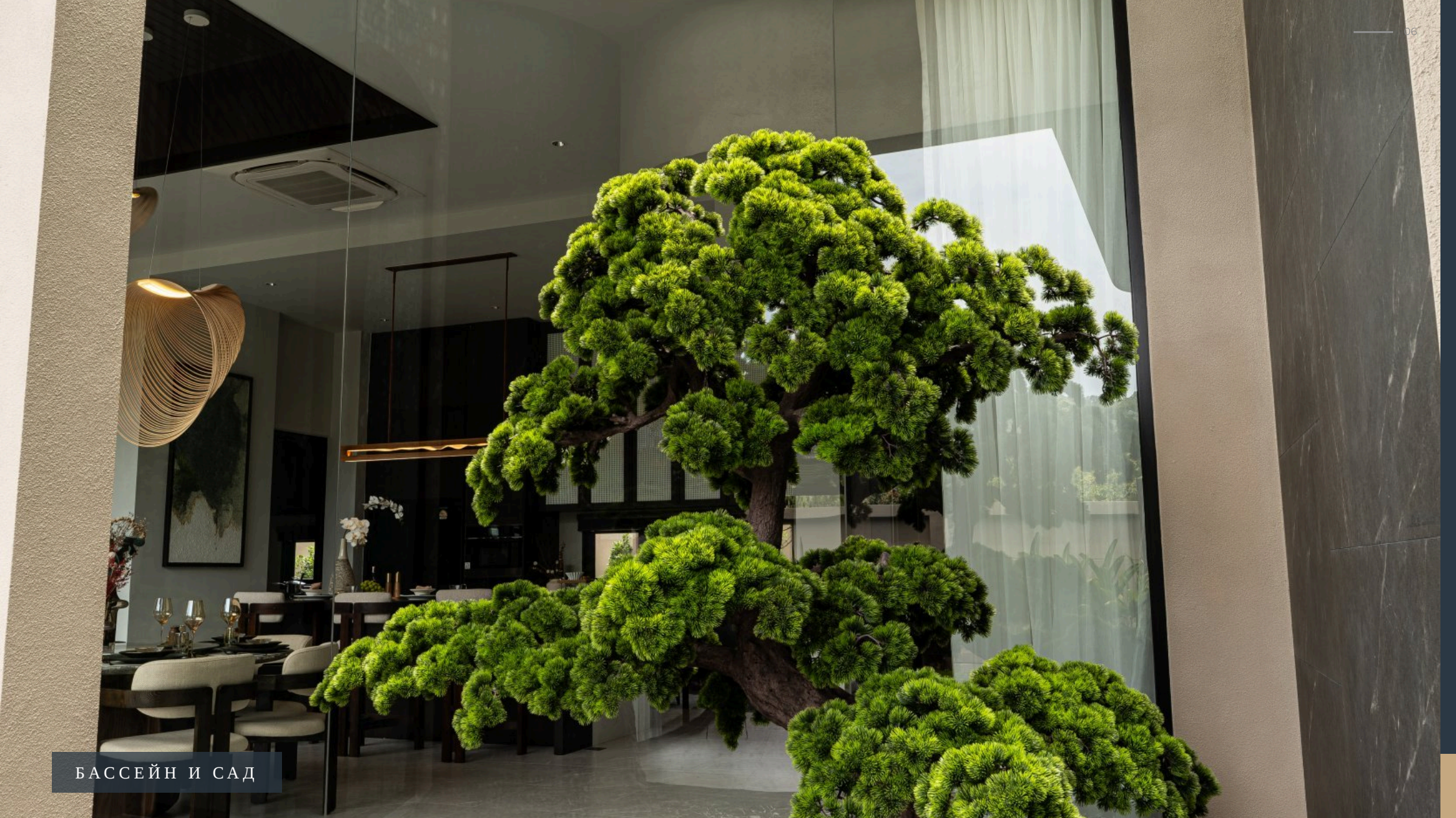
БАССЕЙН И САД