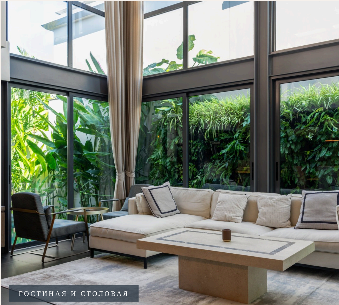
ГОСТИНАЯ И СТОЛОВАЯ