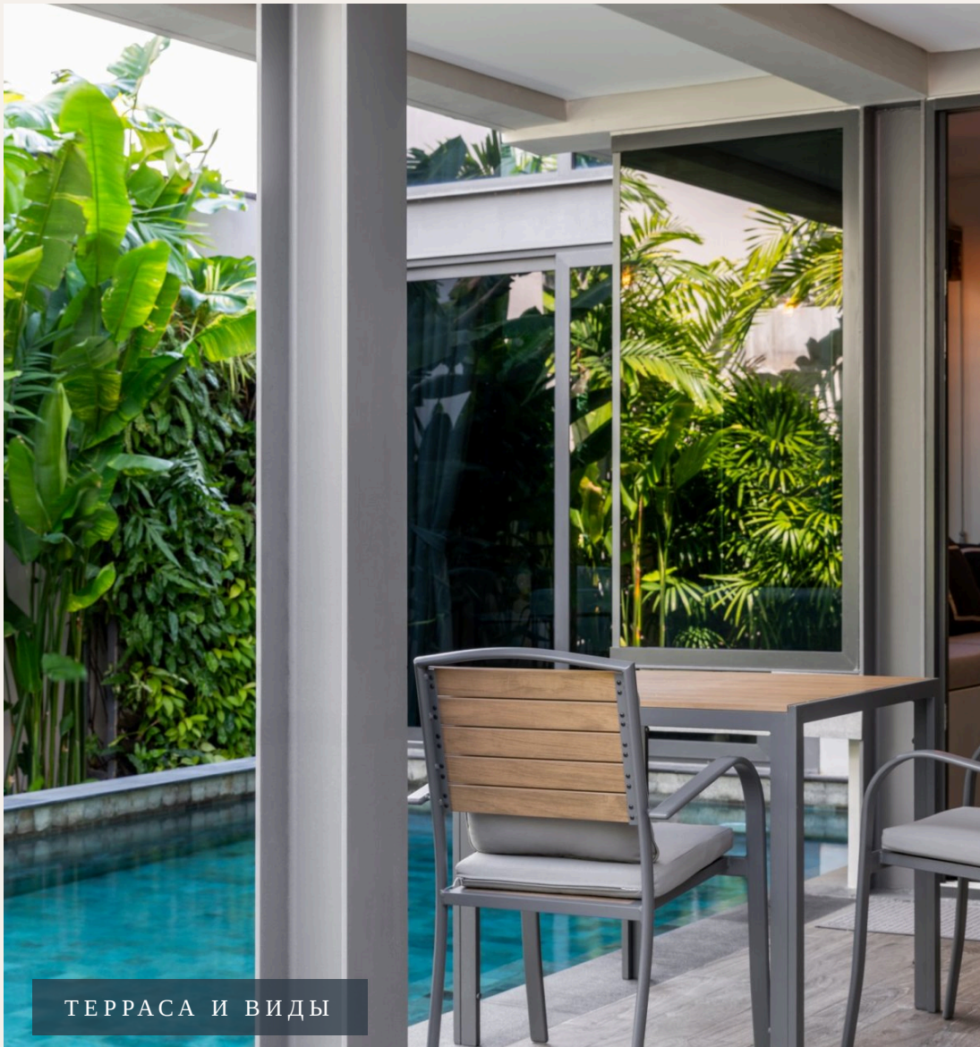
ТЕРРАСА И ВИДЫ