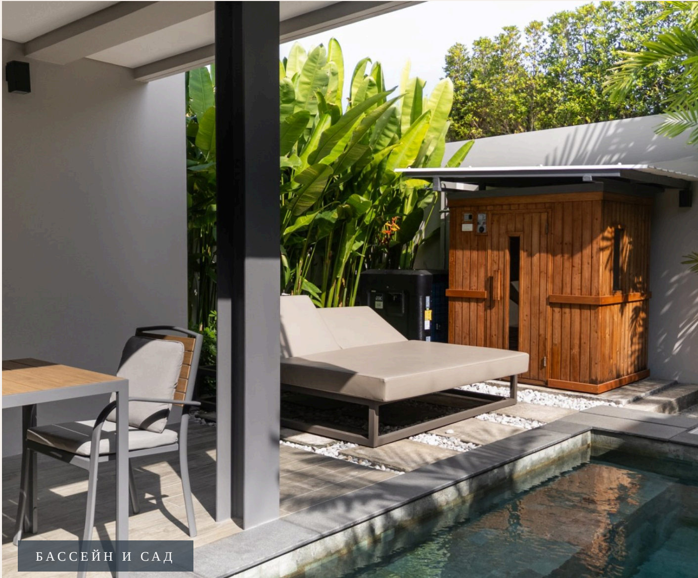
БАССЕЙН И САД