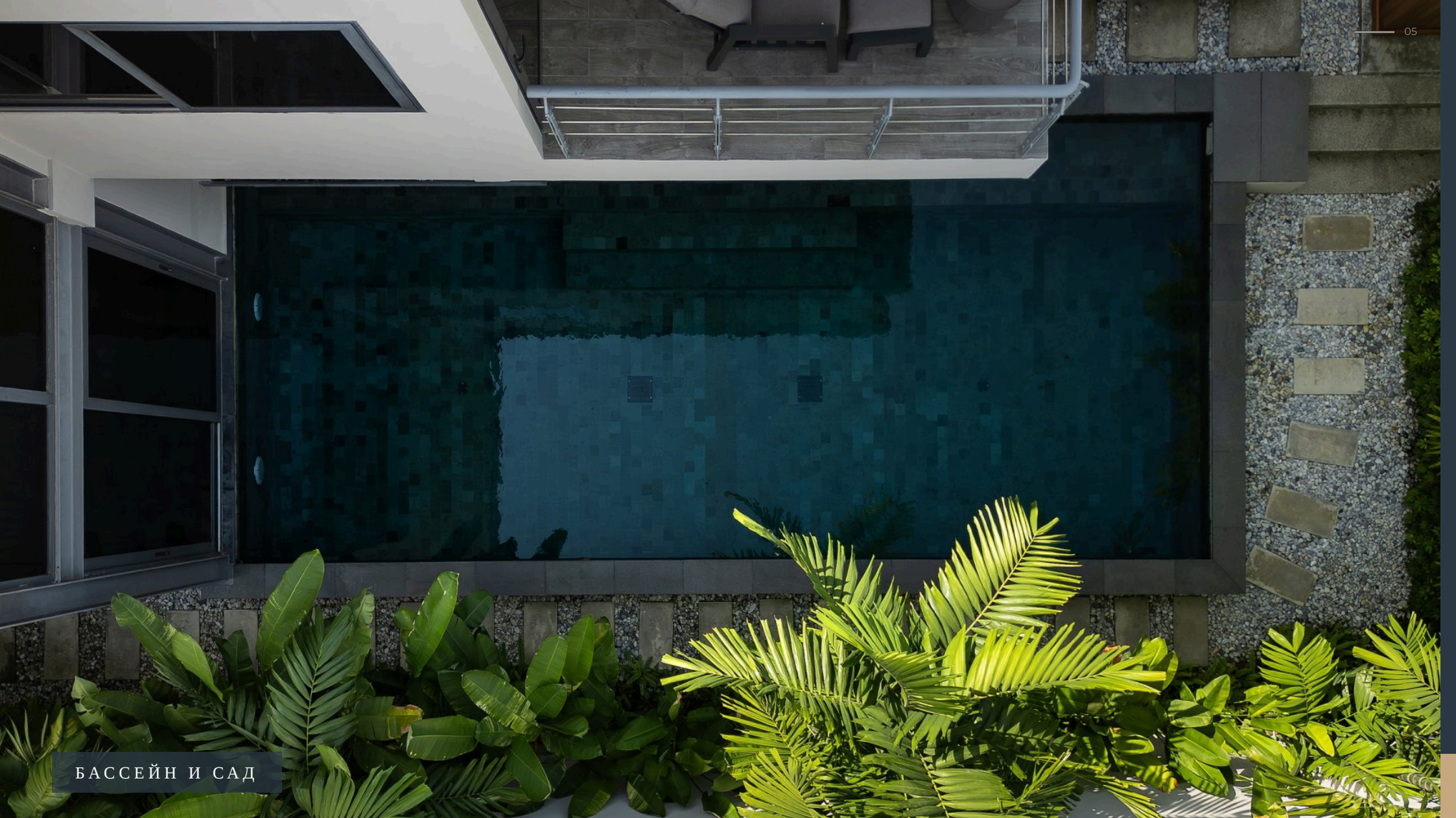
БАСЕЙН И САД