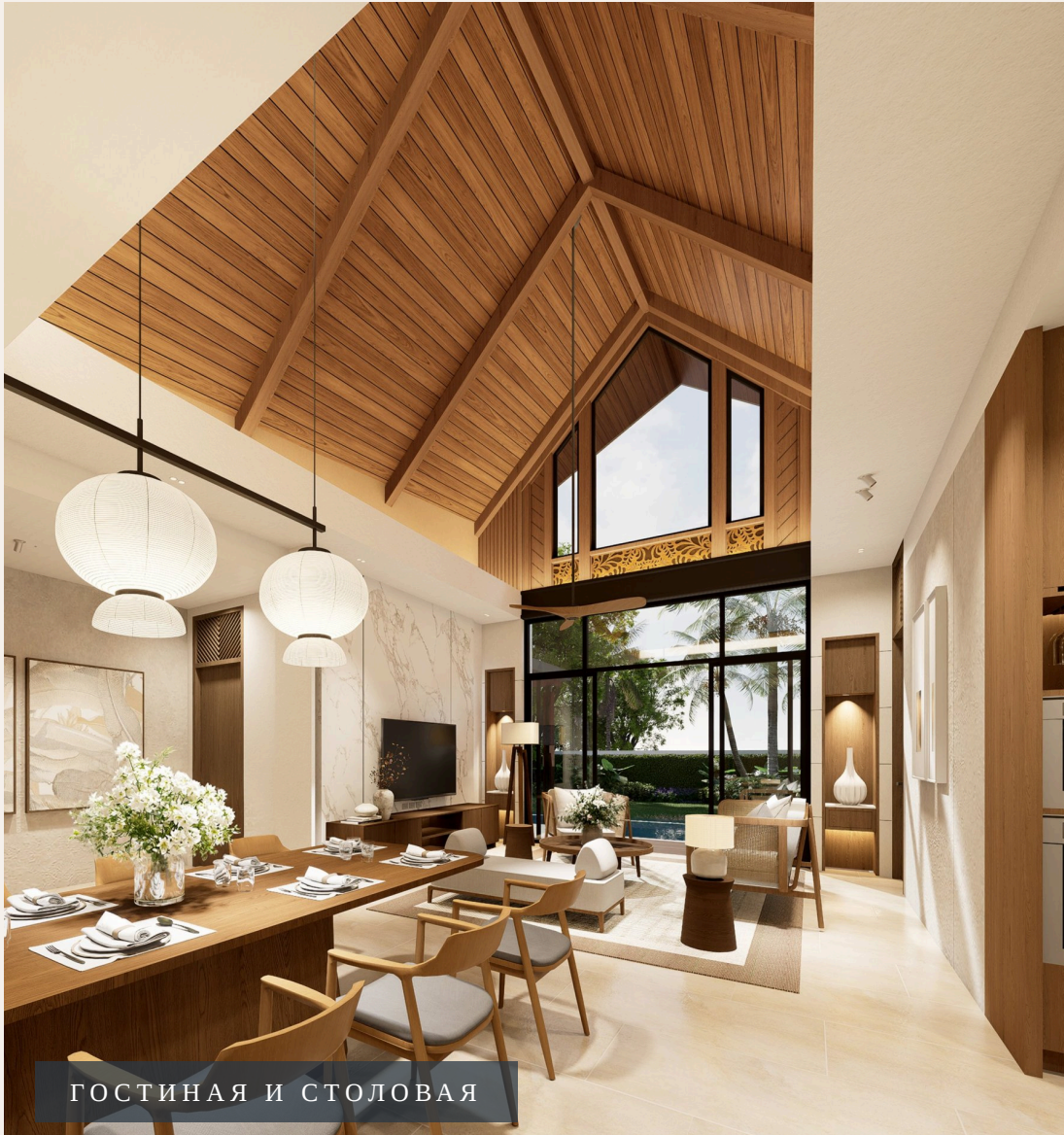
ГОСТИНАЯ И СТОЛОВАЯ