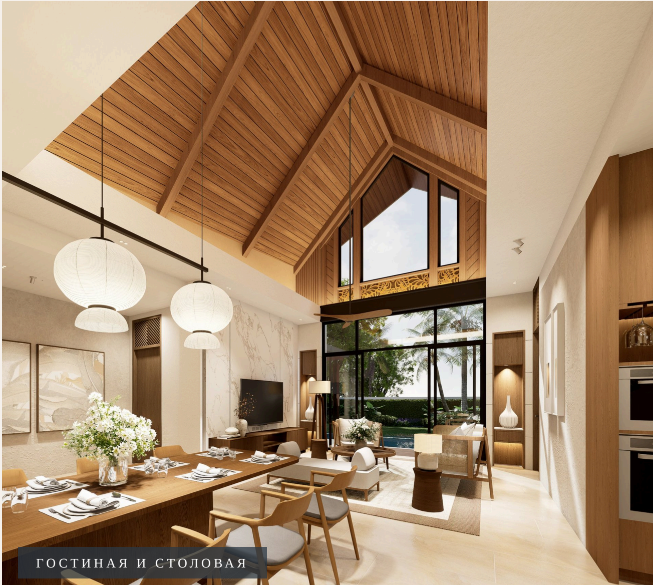
ГОСТИНАЯ И СТОЛОВАЯ