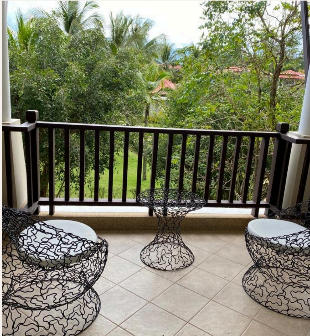
ТЕРРАСА И ВИДЫ