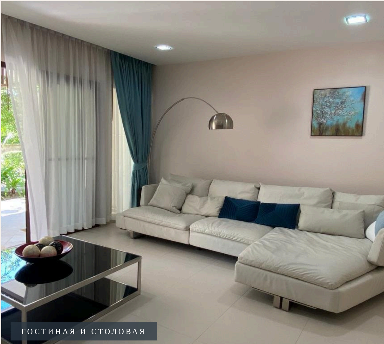
ГОСТИНАЯ И СТОЛОВАЯ