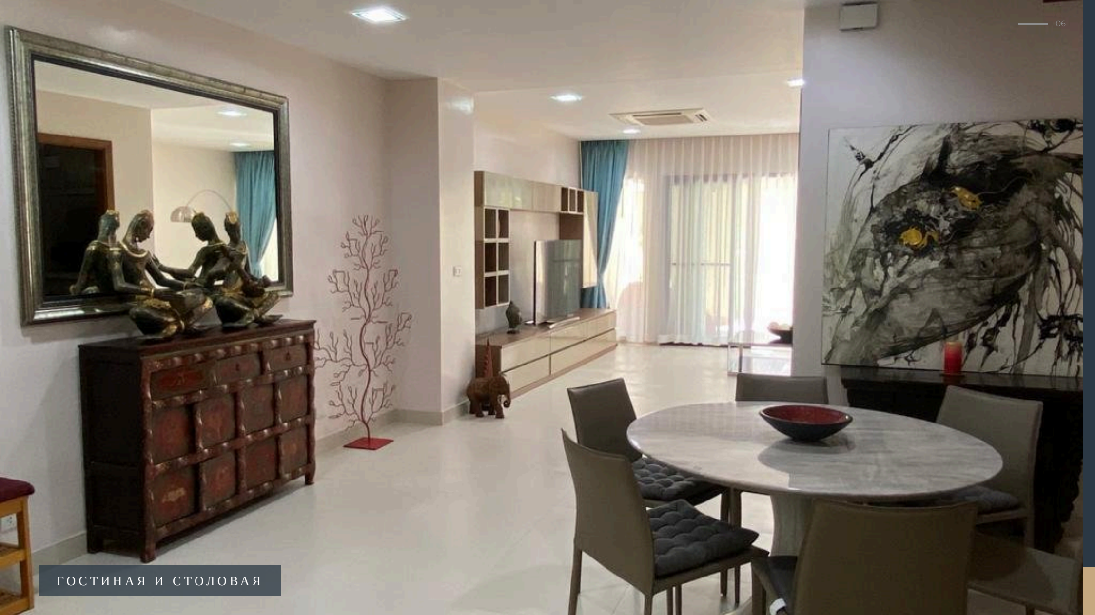
ГОСТИНАЯ И СТОЛОВАЯ