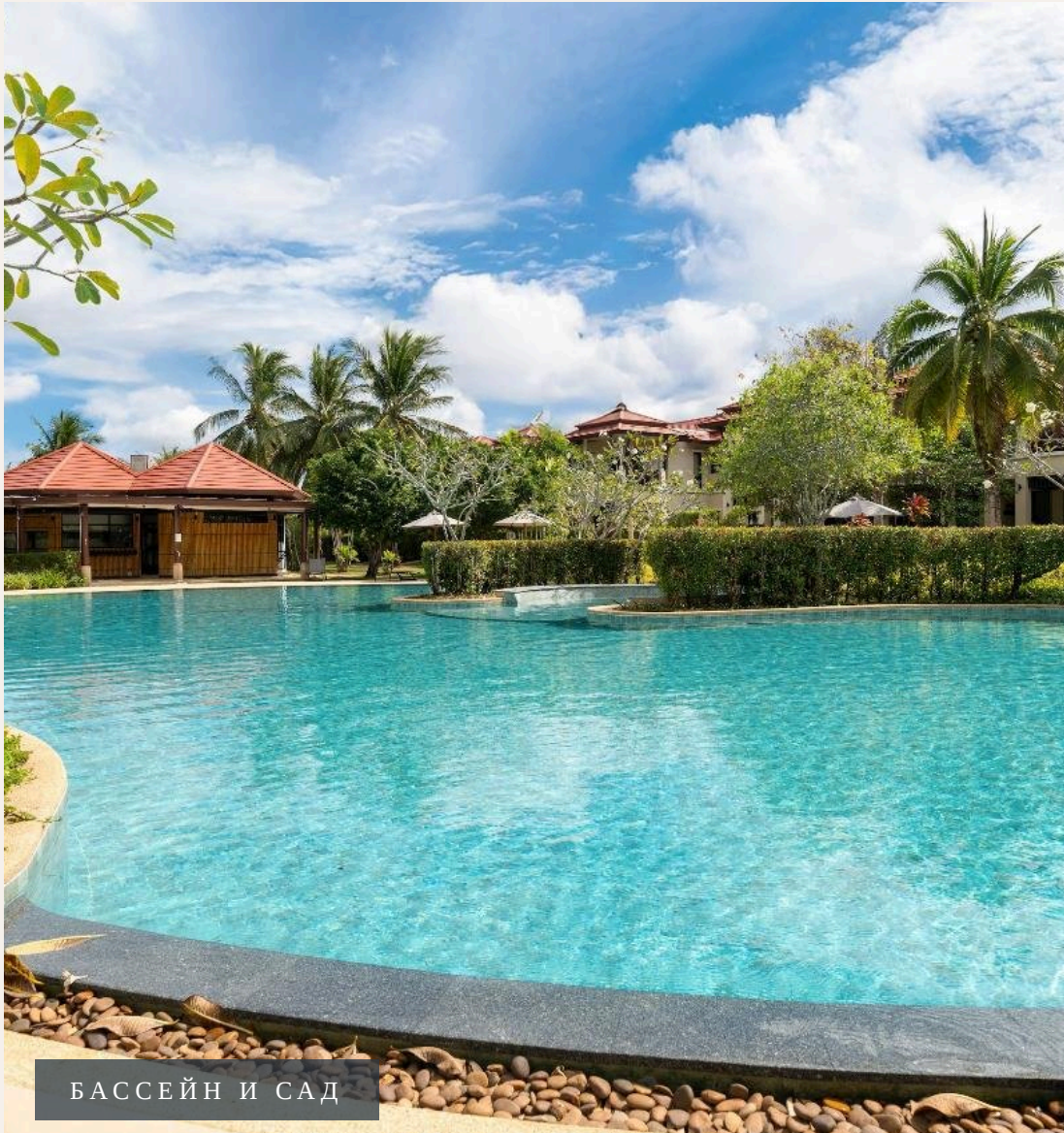
БАСЕЙН И САД