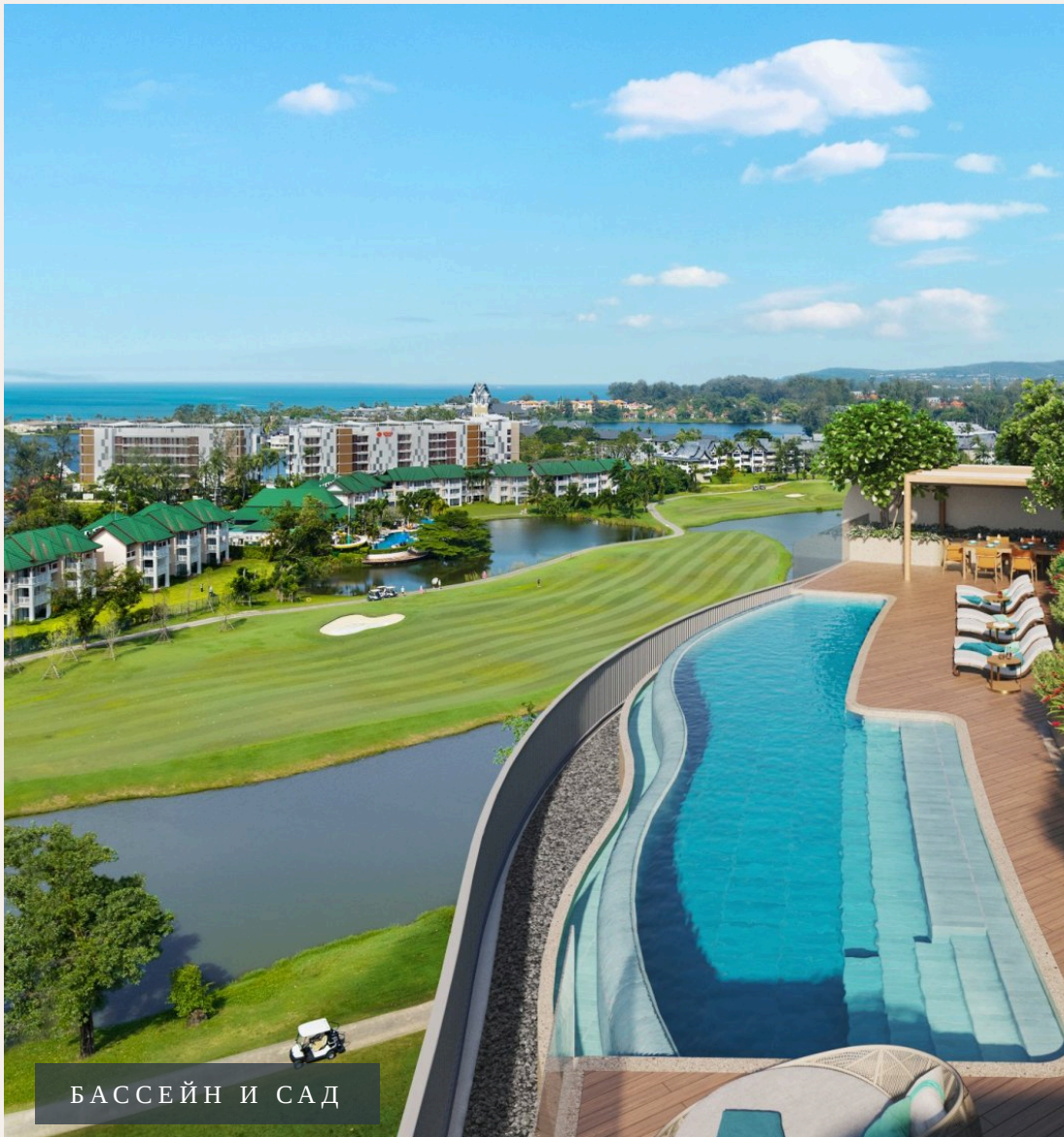
БАССЕЙН И САД