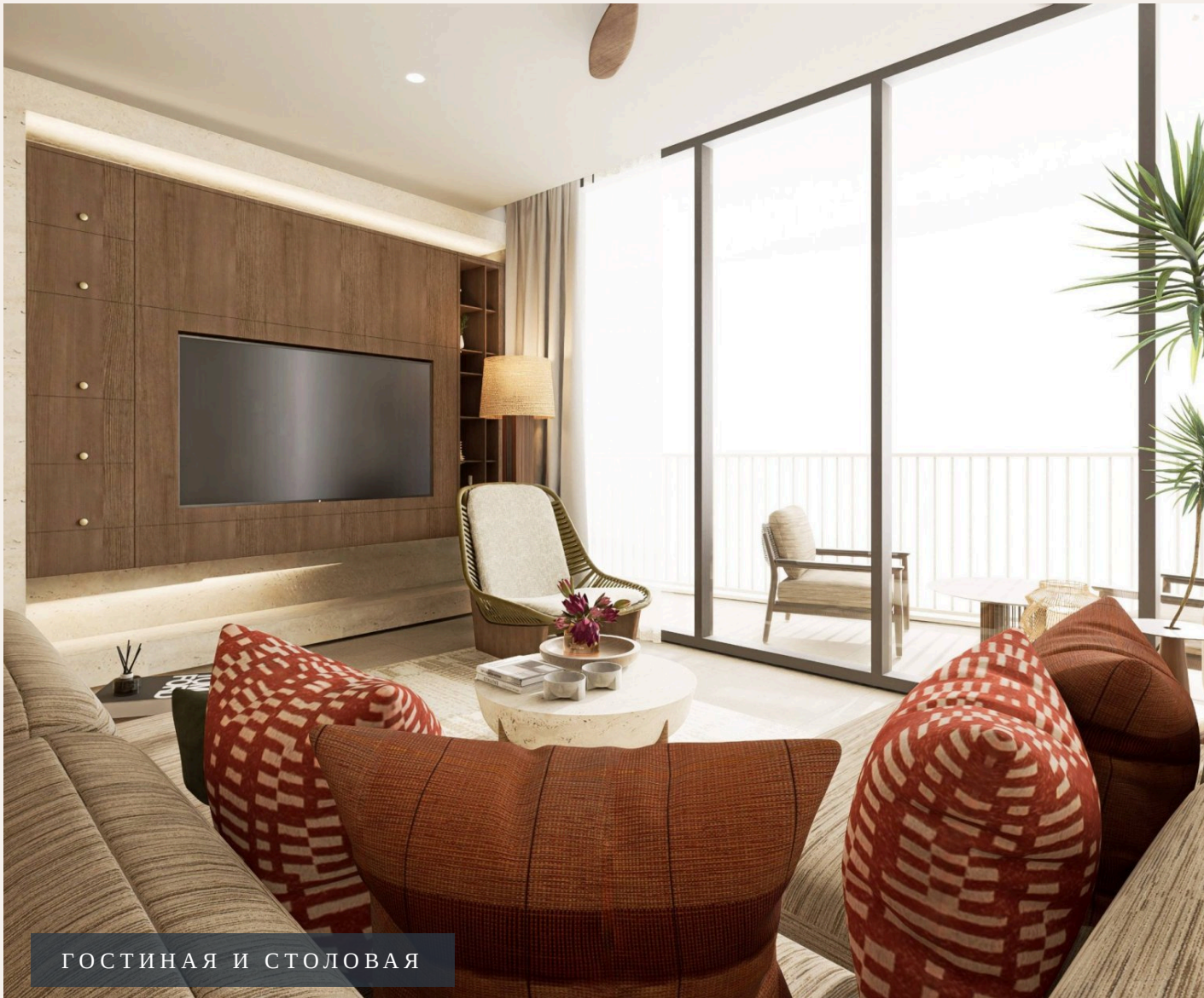
ГОСТИНАЯ И СТОЛОВАЯ