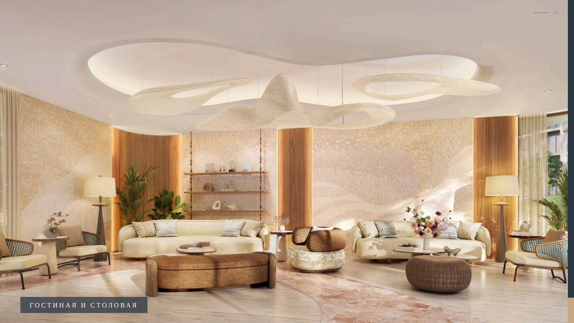
ГОСТИНАЯ И СТОЛОВАЯ