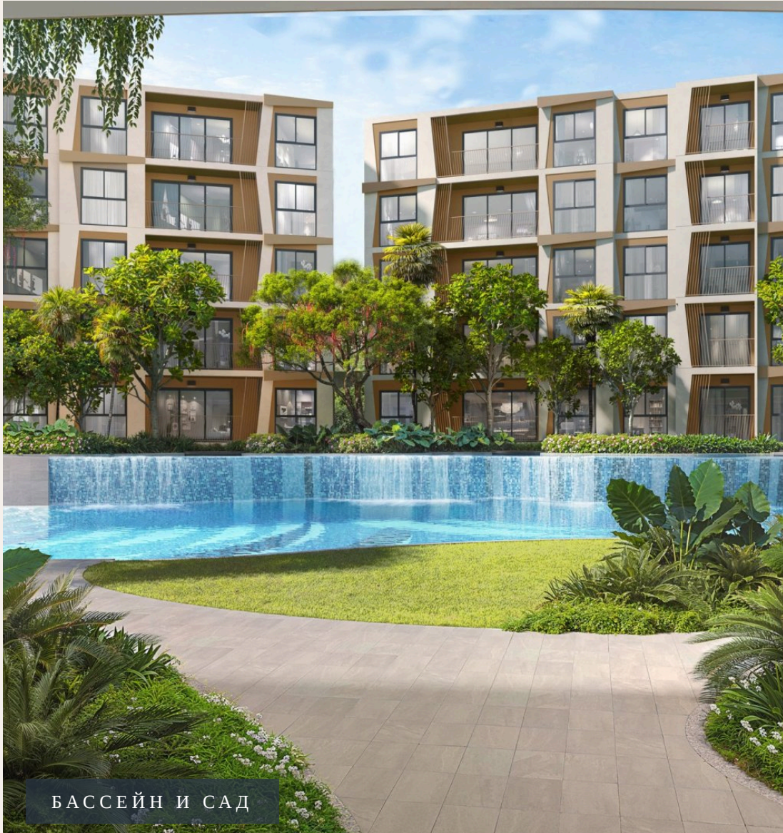
БАССЕЙН И САД