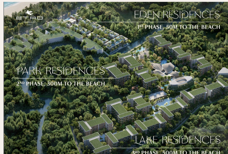
EDEN RESIDENCES 1 ST PHASE, 50M TO THE BEACH