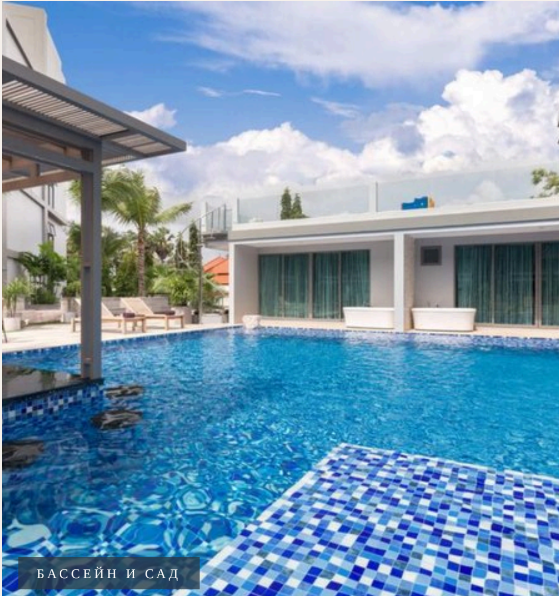
БАСЕЙН И САД