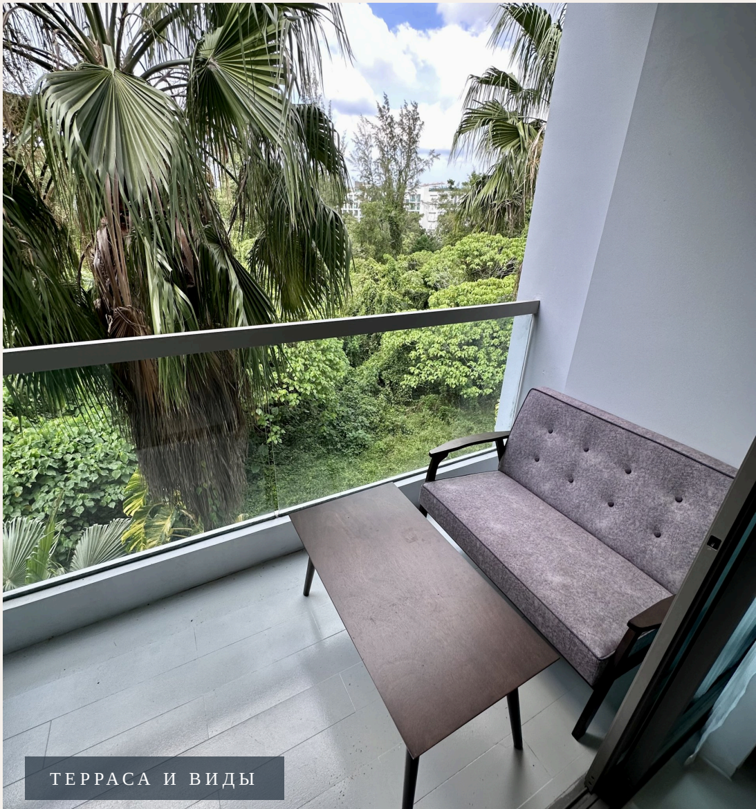
ТЕРРАСА И ВИДЫ