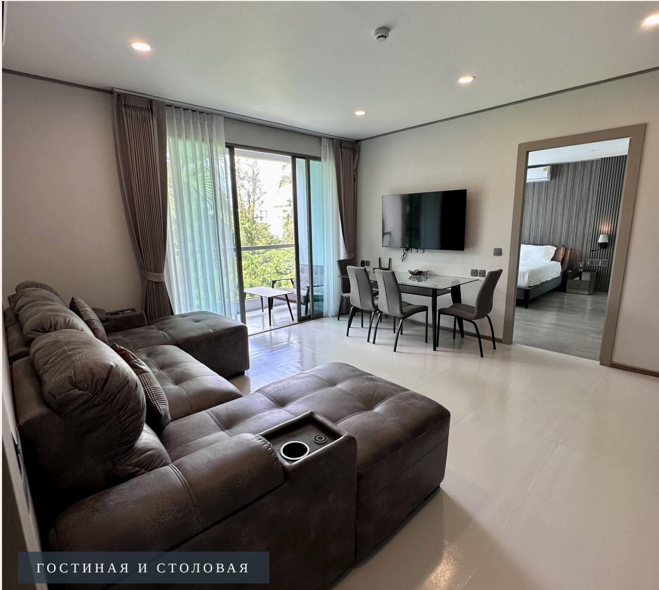
ГОСТИНАЯ И СТОЛОВАЯ