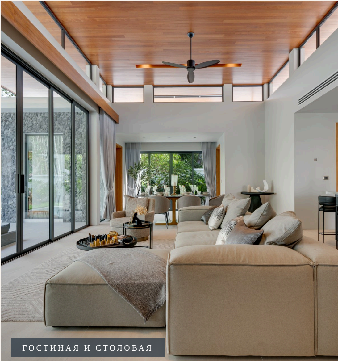
ГОСТИНАЯ И СТОЛОВАЯ