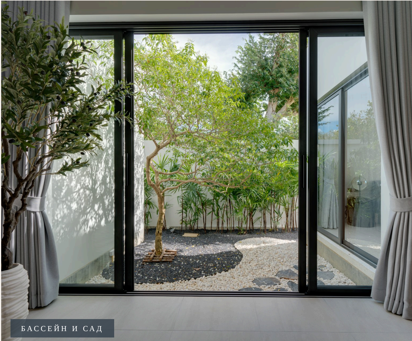
БАССЕЙН И САД