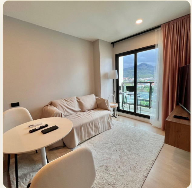
УЮТНАЯ ГОСТИНАЯ С ВЫХОДОМ НА БАЛКОН