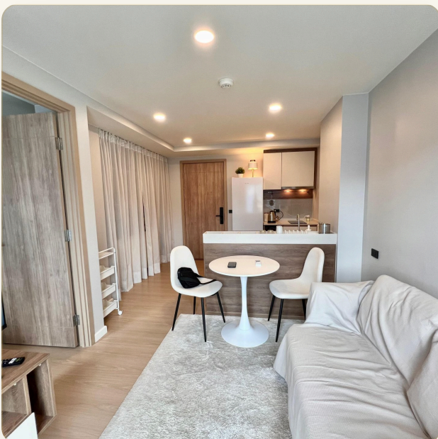
УЮТНАЯ ГОСТИНАЯ С КУХНЕЙ