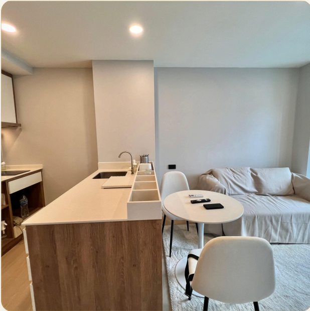
ГОСТИНАЯ ОТКРЫТОЙ ПЛАНИРОВКИ С КУХНЕЙ