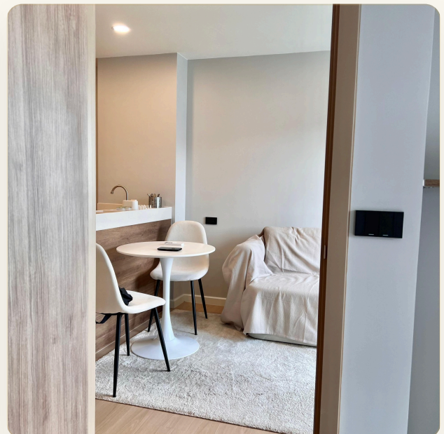
УЮТНАЯ ГОСТИНАЯ С ОБЕДЕННОЙ ЗОНОЙ