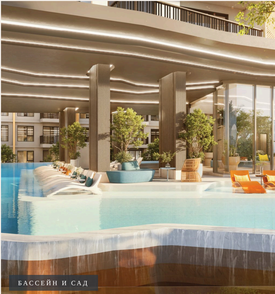
БАССЕЙН И САД