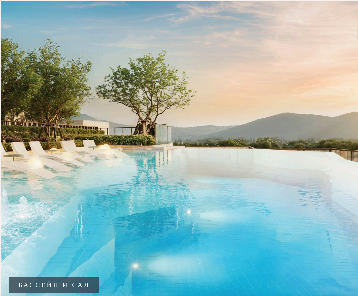
БАСЕЙН И САД