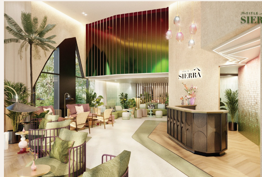
THE TITLE SIERRA