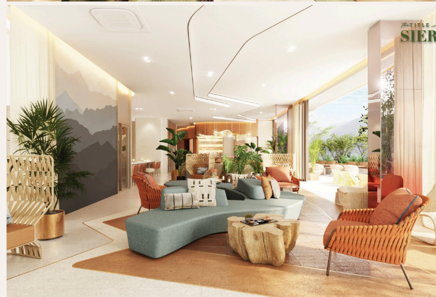
THE TITLE SIERRA