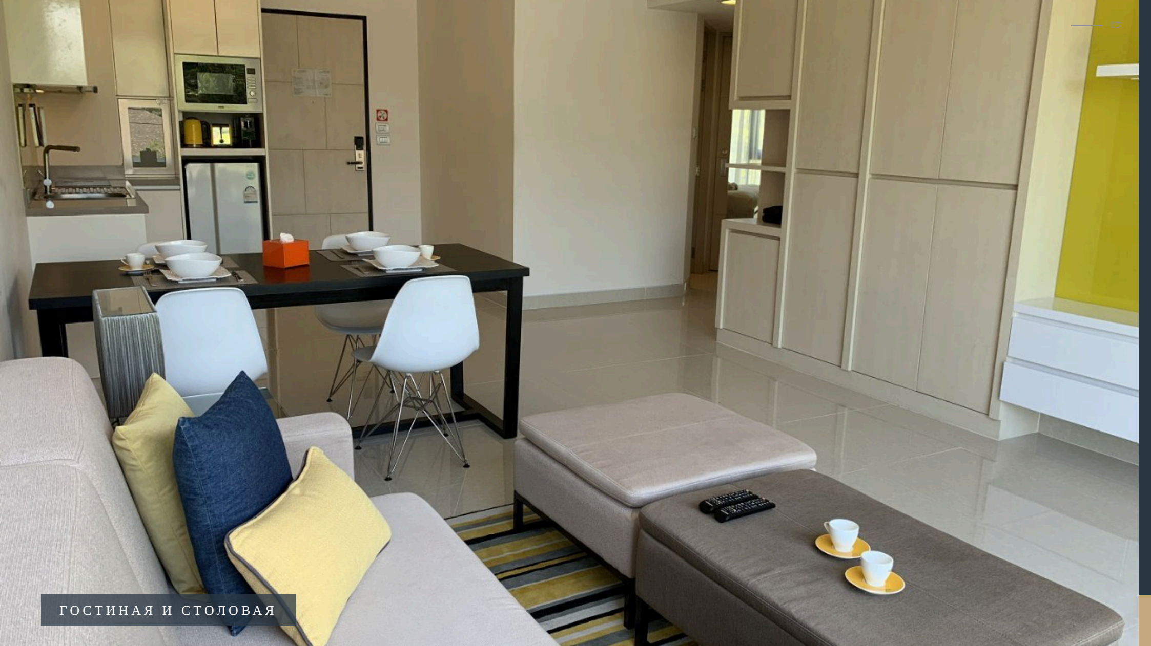
ГОСТИНАЯ И СТОЛОВАЯ