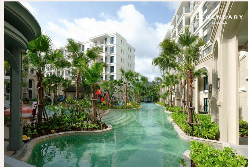
THE LEGENDARY MANGROVE