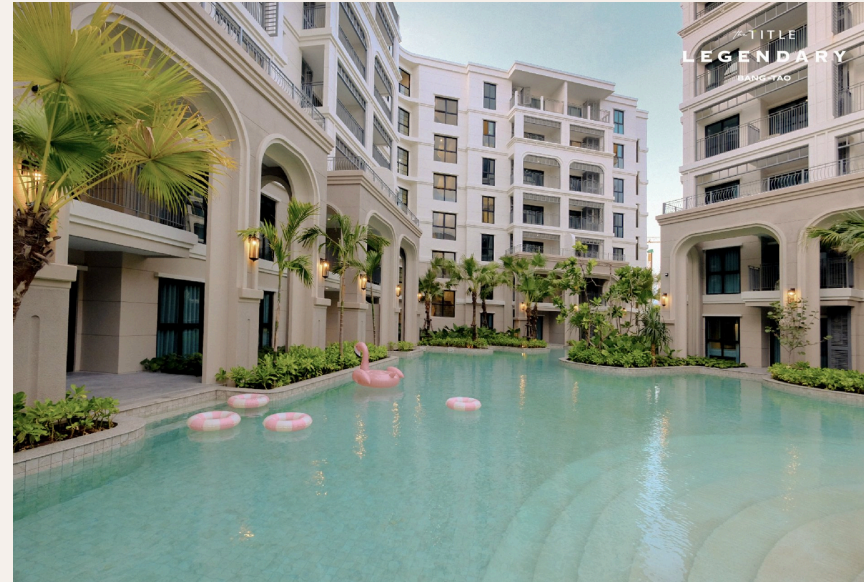
THE LEGENDARY MANGROVE