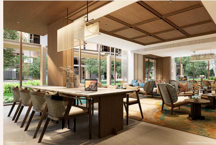
Community function hall