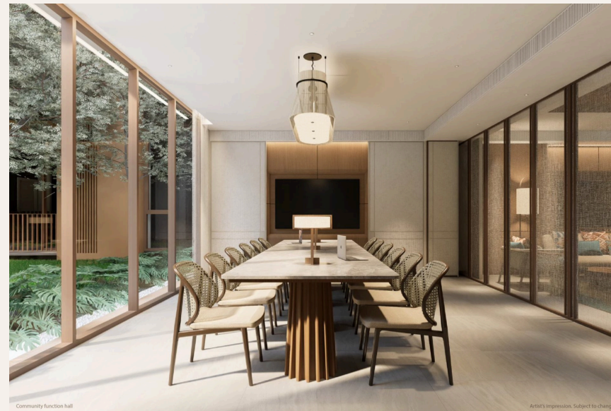
Community function hall