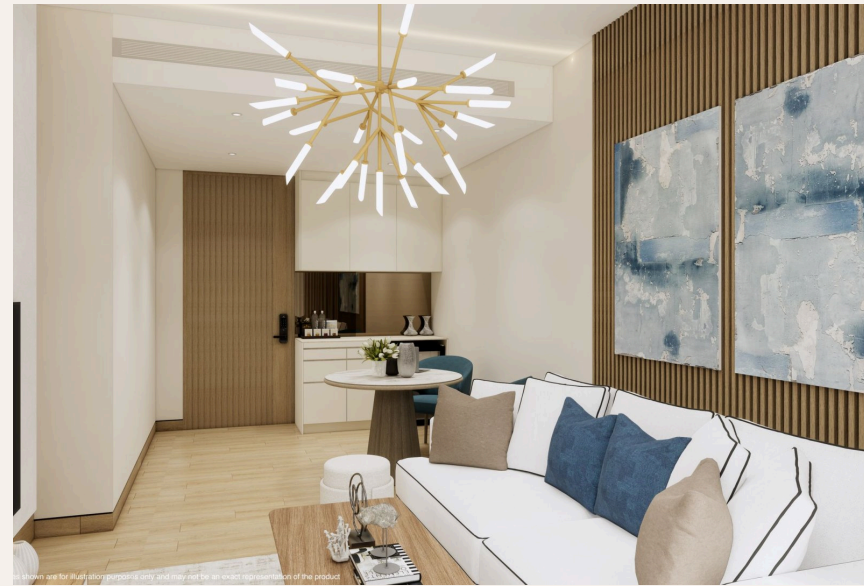
The images shown are for illustration purposes only and may not be an exact representation of the product.