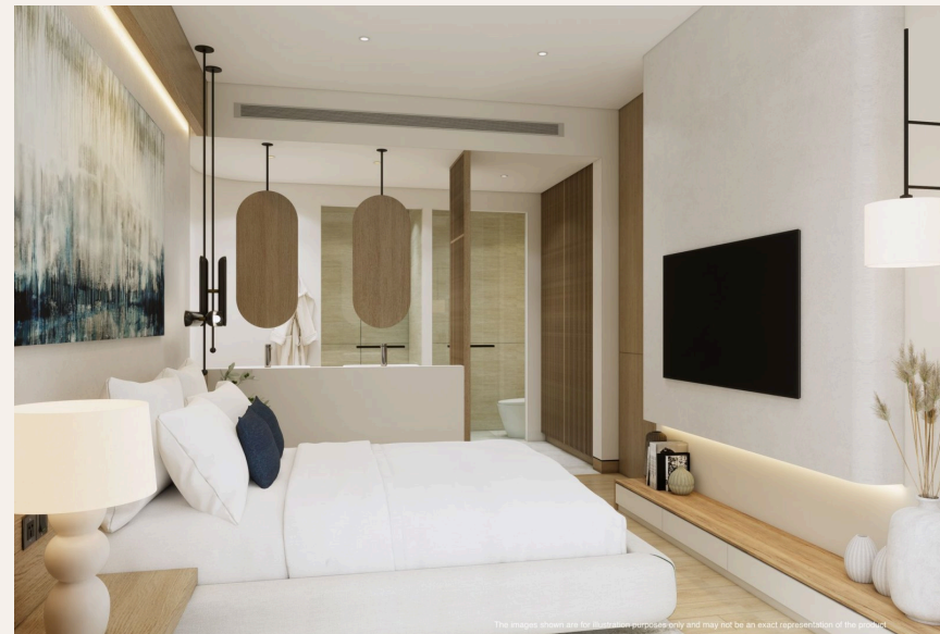
The images shown are for illustration purposes only and may not be an exact representation of the product.