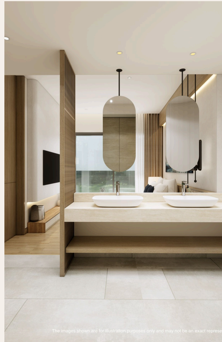
The images shown are for illustration purposes only and may not be an exact representation