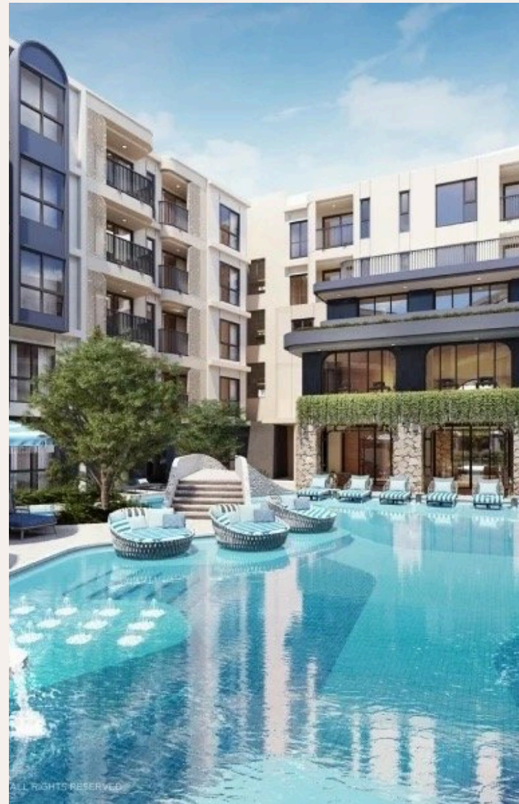
ALL RIGHTS RESERVED