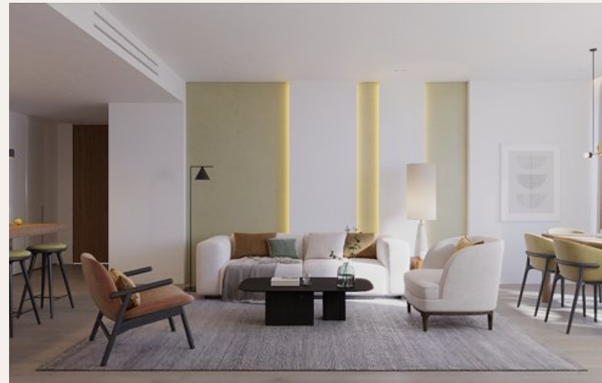
TYPE C - 2 BEDROOMS LIVING ROOM