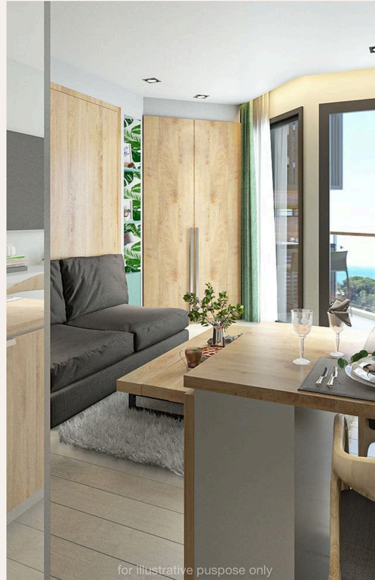
for illustrative purpose only