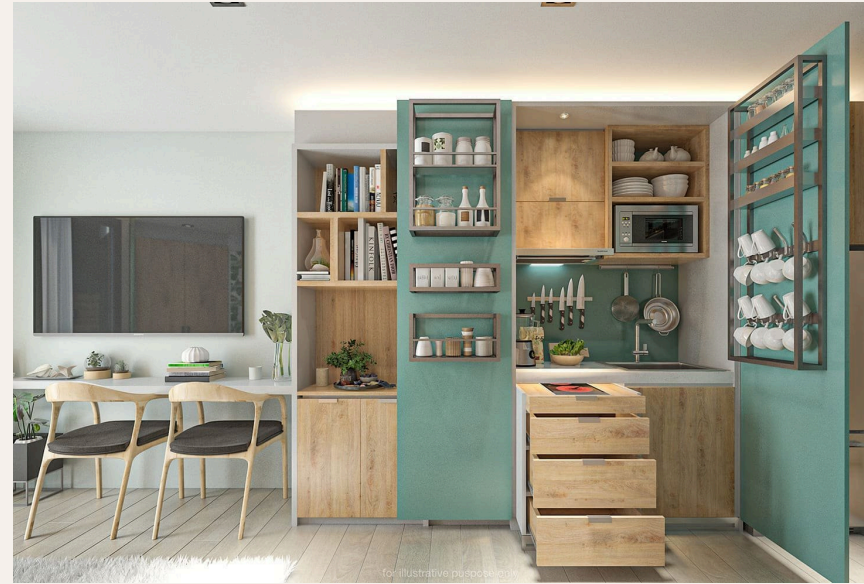
for illustrative purposes only