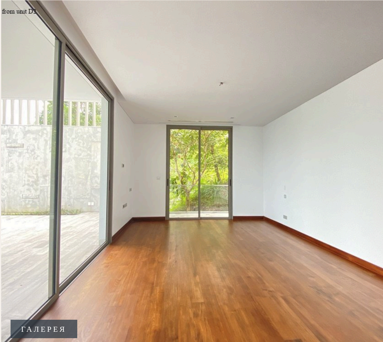
from unit D3