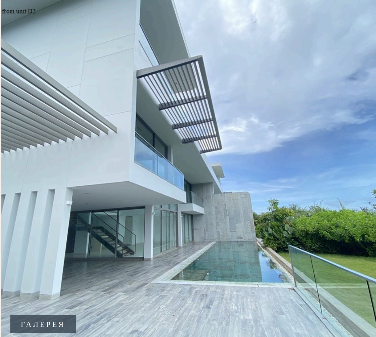
from unit D2