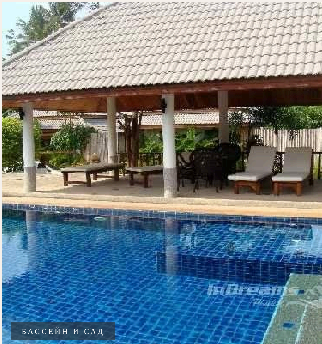
БАСЕЙН И САД