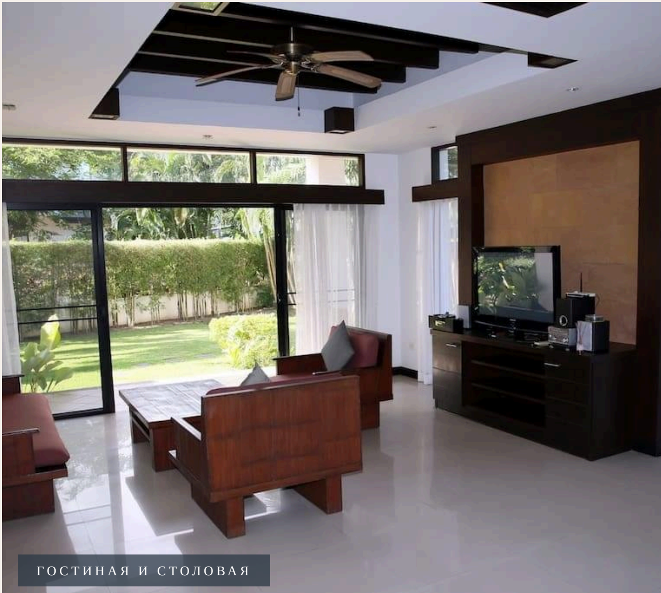
ГОСТИНАЯ И СТОЛОВАЯ